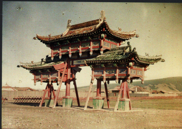
Fig. 148 - Un pailuur (porte triomphale) à l'entrée sud du Palais jaune, Ourga, Mongolie indépendante. Stéphane Passet, juillet 1913, inv. A 5 455.

A pailuur (triumphal gate) at the south entrance to the Yellow Palace.